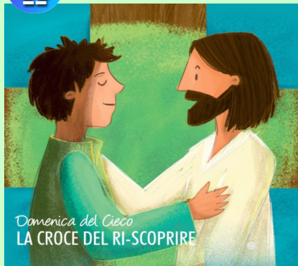
Domenica del Cieco LA CROCE DEL RI-SCOPRIRE

Nella Domenica del Cieco, la Croce del RI-SCOPRIRE ci richiama alla luce che Gesù dona a chi crede in Lui. Come il cieco nato, siamo chiamati a risvegliarci da ogni buio che ci tiene bloccati e a riscoprire ogni giorno la presenza viva del Signore nella nostra vita. Riscopriamo chi è Gesù e chi è Gesù per noi.